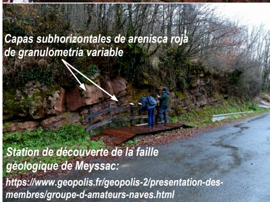
Capas subhorizontales de arenisca roja de granulometría variable