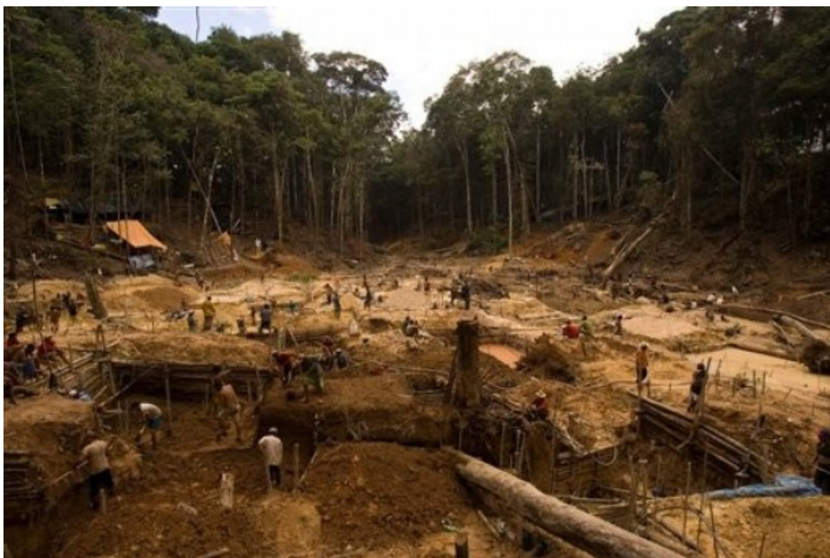
Explotación artesanal de oro en la selva amazónica de Brasil (Eldorado do Juma)

Director Progr. Diplomado en Gestión Ambiental Minera (GAM – ULS.) Coord. Acad. Progr. Diplomado en Sustentabilidad Ambiental Minera (ULS.) Prof. Titular Depto. Ingeniería de Minas Universidad de La Serena (Chile). Carreras Ingeniería Civil Ambiental e Ingeniería Civil de Minas.